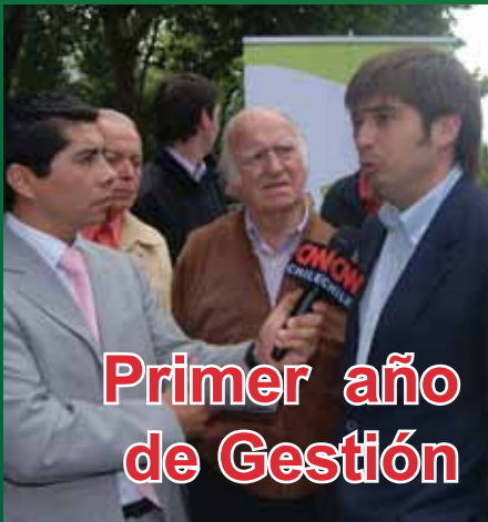
Primer año de Gestión